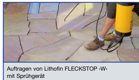
Auftragen von Lithofin FLECKSTOP ›W‹ mit Sprühgerät